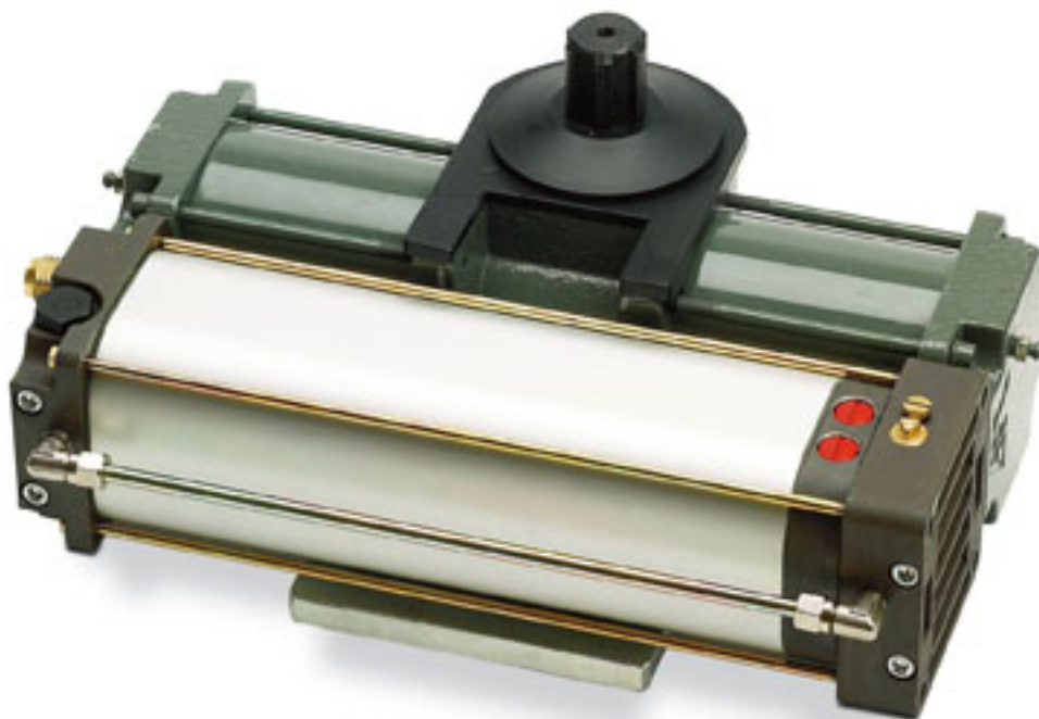
SUB - Siłowniki hydrauliczne 24V do bram skrzydłowych rezydencjalnych

Siłowniki podziemne do bram skrzydłowych, do 3,5 m / 800kg, 230 V, sprzedawane pojedynczo, przeznaczone do pracy intensywnej